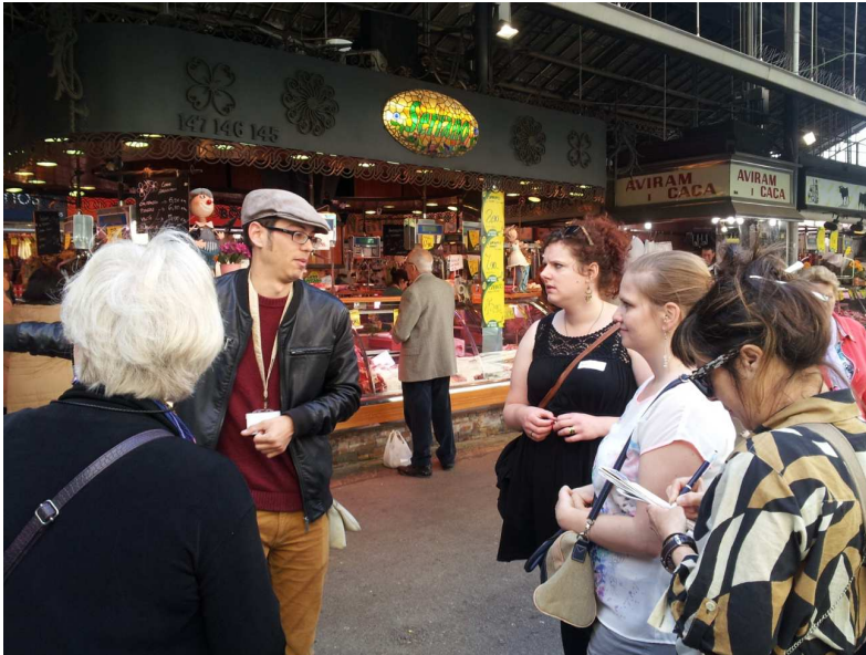
Mercat de la Boqueria

La següent aturada del Barcelona Walking Tour Gourmet és el mercat de Sant Josep, més conegut com la Boqueria, i que ocupava l'emplaçament de l'antic convent de Sant Josep.