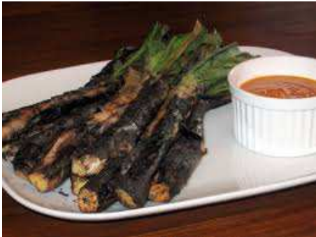
Calçots amb salsa romesco